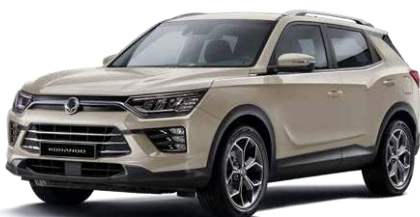
LATTE greige (EBL)