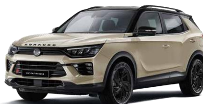
LATTE greige (EBL) Black Pack