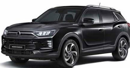
SPACE black (LAK)