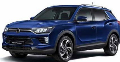
DANDY blue (BAS)