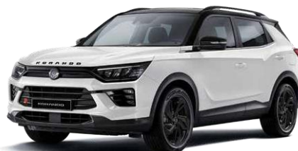
Grand white (WAA) Black Pack