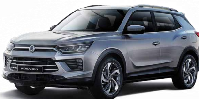
Iron metal (ADE)