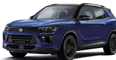
DANDY blue (BAS) Black Pack