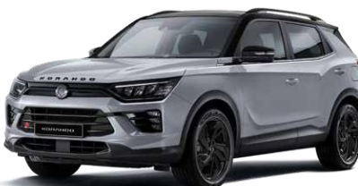
Iron metal (ADE) Black Pack