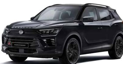
SPACE black (LAK) Black Pack