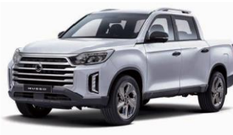
SILKY WHITE (Pearl) (WAK)