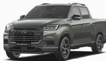
AMAZONIA green metalizat (GAM)