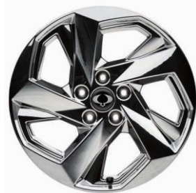
Jantă Aliaj Cromată De Cu Anvelope 20" 255/50 R20 Tyres