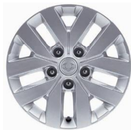
Jantă Aliaj 17" Cu Anvelope 235/70 R17 XI