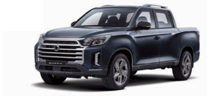
GALAXIES grey metalizat (ADB)