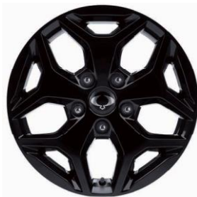
Jantă Aliaj În Culoare Negru 18" Cu Anvelope 255/60 R18