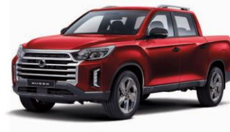
INDIAN red metalizat (RAJ)