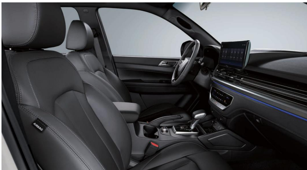
Textil negru, plafon negru (LBT1)