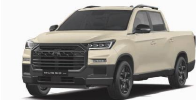
SAND beige metalizat (EBK)