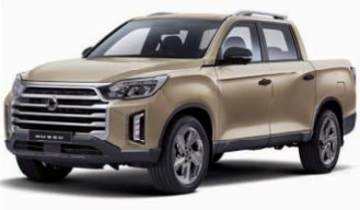
SAND beige metalizat (EBK)