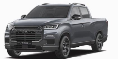
MARBLE grey metalizat (ACM)