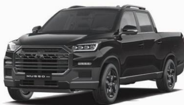
SPACE black metalizat (LAK)