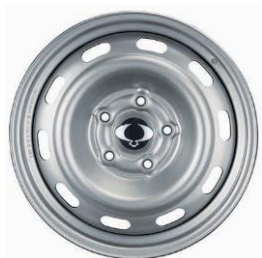
Jantă Oțel 17" Cu Anvelope 235B84:B109/70 R17 XI