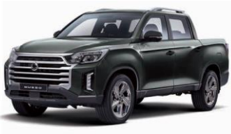
AMAZONIA green metalizat (GAM)