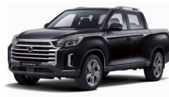
SPACE black metalizat (LAK)