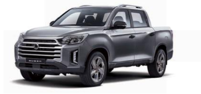
MARBLE grey metalizat (ACM)